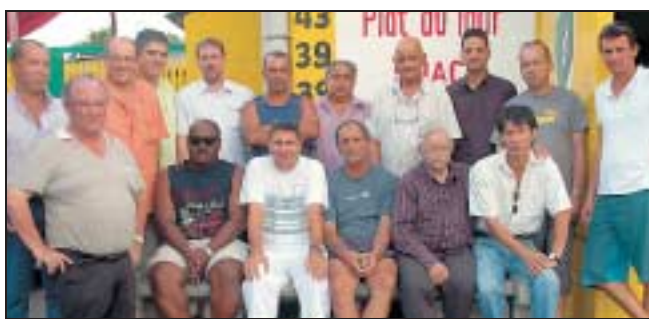
Les 16 finalistes du challenge (A) du championnat en duplicate réunis samedi au Port.